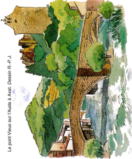
Le pont Vieux sur l'Aude à Axat. Dessin R.-P. J.